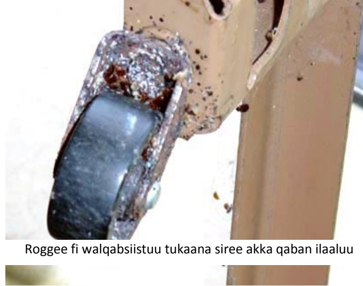
Roggee fi walqabsiistuu tukaana siree akka qaban ilaalu

Erga teessuu fi meeshaalee tokko tokko sakkataatee booda mi'oonni hafan yoo jiraatan ilaaluun gara naannoo qulqulluutti dabarsi. Akkuma armaan olitti caqasametti afaa manaa, ulaa fi dhoohaan yoo jiraate ilaali.