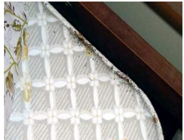
Qarqaraa fi keessa firaashii sakkatta'uudhaan tukaana siree mallattoo isaa beekaa.

Siree irraa jalqabiuun gara boraatii, firaashii fi kan biraatti darbi. Jalqaba kannen mul'achuu danda'an sakkatta'i. Sana booda wantoota dhokanii jiran ilaali. Teessoon firaashii kan siree irra jiru roga shananiinuu ilaalamuu qabu. Erga irra gubbaa isaa ilaaltee booda garagalchuudhaan dugda duuba isaas sakkatta'i.