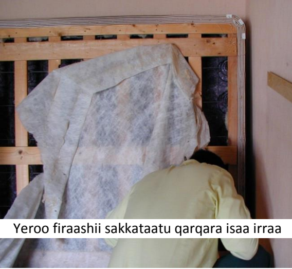
Yeroo firaashii sakkataatu qarqara isaa irraa

Haaluma wal fakkaatuun firaashiis sakkata'i. kan adda isa taasisu firaashiin qarqara isaatiin pilaastikii furdisuuf itti hodhame qabaachuu isaati. Hidhiin firaashii qarqara irratti hodhamee jiru kun yeroo heedduu iddoo tukaanni siree dhukatu dha. Tukaanni siree miliqee akka hin hafneef qarqara firaashii sanaa sirriitti urgufuudhaan ilaaluun barbaachisaa dha. Erga sakkataanee ilaallee booddee qarqara hodhaa firaashii sana iddoo isaatti deebisuun kaa'uun dagatamuu hin qabu.